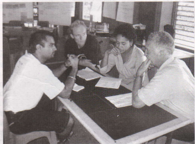
Eratou veitalanoa tiko ogo na vakailesilesi ka ratou vakayaco vuli tiko. Taba e vakarautaka na Birdlife International.

Dua talega na ka levu era vulica oya na kena volai na Project Proposals ka ra dau vola ga vakalevu ko ira na cakacaka ena veitabana sega ni vakamatani (NGO's). Na vuli ka qaravi e levu ga kina na nodra veitalanoa vakaiwasewase na lewe ni vuli ka ratou cakacaka tiko ga ena rua na case study oya mai Natewa kei Nabukelevu.