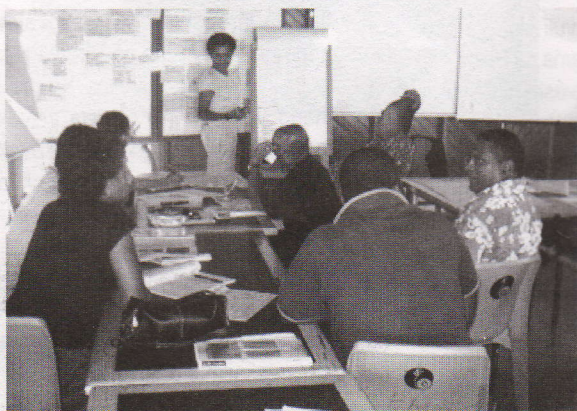
Ogo ena dua na gauna ni nodra soli vakasama na tiko rawa ena vuli ni kena maroroi na i yaubula.

E vuqa sara na veika yaga e vulici ni oti na vuli siga va ogo me vaka na kena tauyavutaki e dua na Project kei na veika kece e rawa ni tekivutaki kina e dua na Project (Project Development).